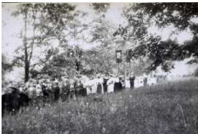
1942 - Po zákazu v obci se konal průvod Božího Těla v zámeckém parku

Záborem pohraničí v r. 1938 byla naše farnost včleněna do tzv. Sudetoněmecké župy a Hlučínsko se stalo součástí starého Německa. Olomoucká diecéze byla tak roztržena na pruskou a sudetskou část. Sídlo arcibiskupa zůstalo sice v Olomouci, ale řízení děkanátů bylo přeneseno na generální vikariát do pruské „Branitz“ - dnes polská Branice nedaleko Krnova.